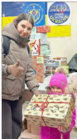
Geschenke für ukrainische Kinder

Mitte Januar fuhr ein Lastwagen mit 16,6 Tonnen Hilfsgütern von unserer Sammelstelle in Sulzberg-Ried direkt nach Kiew. Für diesen 65. Hilfstransport hatte das Helferteam über 50 Rollatoren sowie Rollstühle geladen. Hinzu kamen viele Kartons mit medizinischen Artikeln und unzählige Säcke voller warmer Decken, Kissen aber auch Bettwäsche. Diese Sachen brauchen die Menschen bei den eisigen Temperaturen dringend. Mit Spendengeldern kauften wir Stromgeneratoren und große Mengen Lebensmittel. Besonders wichtig sind auch Maxi-Windeln für traumatisierte Kinder