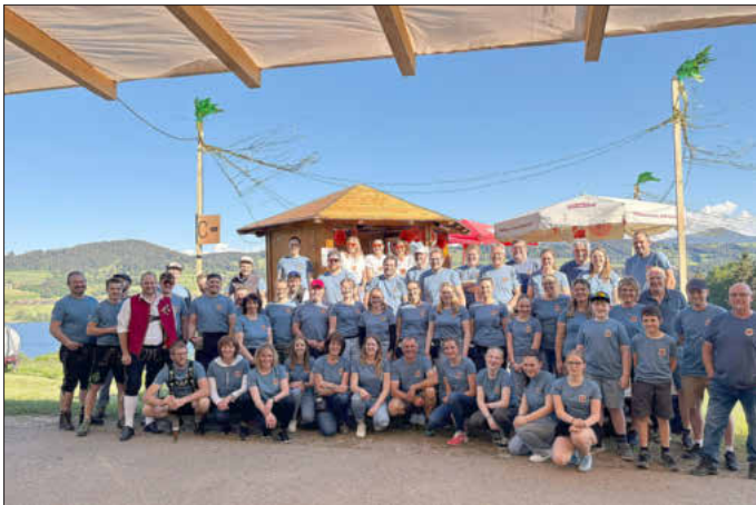
Ein starkes Team: Die freiwilligen Helferinnen und Helfer unseres Musikfests.

Es war uns eine Freude, mit euch allen unser Jubiläum zu feiern.