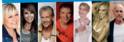
Gaby Baginsky, Ireen Sheer, Olaf Berger, Peter Orloff, Vincent Gross, Loona und Olaf Henning