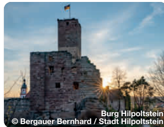
Burg Hilpoltstein