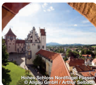
Hohes Schloss Nordflügel Füssen