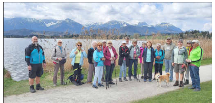
18 Teilnehmer mit der Kümmerei unterwegs

Die 7 Kilometer lange Frühlingswanderung auf dem Hopfensee-Rundweg hielt genau das, was sie verspricht: pure Entspannung. Die Luft war klar, das Wasser des Hopfensees spiegelglatt und die Alpen schienen zum Greifen nah. Ohne nennenswerte Steigungen führte uns der Weg in knapp zwei Stunden einmal komplett um den See.