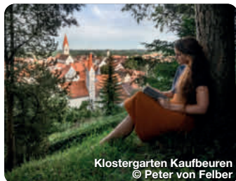
Klostergarten Kaufbeuren

Wie ein Schatzkästchen liegt er im Herzen des Allgäus, im bayerischen Süden Deutschlands. Er ist einer von neun Erlebnisräumen der Region und erstreckt sich über den gesamten Landkreis Ostallgäu, von Füssen über Pfronten, Nesselwang, Halblech, Marktobderdorf bis nach Kaufbeuren und Buchloe. Die königliche Gipfelkulisse aus Ammergauer, Allgäuer und Tannheimer Bergen wachen wie steinerne Riesen über mystische Seen, rauschende Flüsse, sanft gewellte Hügelmeere und sattgrüne Wiesen, zwischen die Dörfer und historischen Städte eingebettet sind. Die archaische Poesie der Landschaft wirkt wie ein großer, weiter Park, der sich vor den vielen Schlössern und Burgen der Region ausbreitet, vor allem zu Füßen des Märchenschlosses Neuschwanstein. TreffpunktDeutschland.de/ostallgaeu