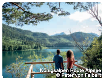
Königsalpen Route Alpsee