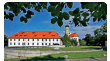
Sankt Martin mit Schloss Marktobderdorf / Sabrina Schindzielorz