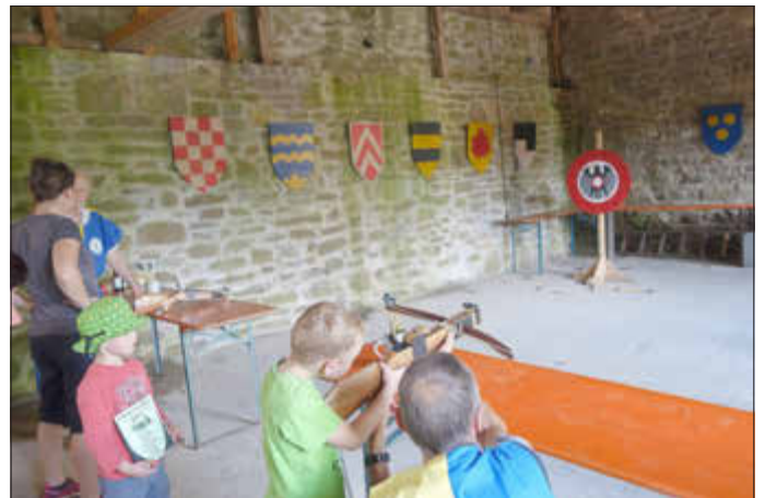
Gerhard Frey 1. Bürgermeister