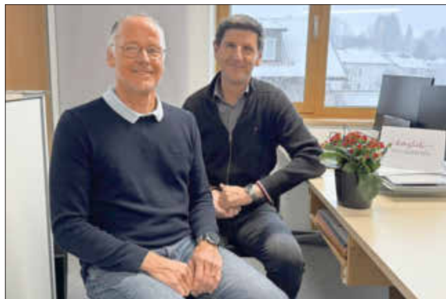
Fortsetzung Seite 2