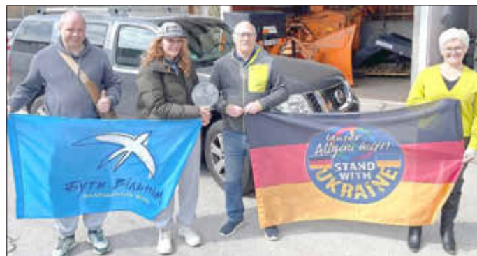
Übergabe des gespendeten Autos

Weitere Informationen: www.unser-allgaeu-hilft.com oder telefonisch ab 15 Uhr unter 0171/9510445. Die Sammelstelle in Sulzberg, Ried 8, ist samstags von 9 bis 12 Uhr geöffnet. Wir freuen uns über Ihre Sach- und Geldspenden. Ihre Geldspenden (auch bar an der Sammelstelle möglich) verwenden wir für dringend benötigte Lebensmittel, Hygieneartikel und für den Transport. Überweisungen bis 300 € (Kontoauszug gilt als Spendennachweis beim Finanzamt) auf unser Konto „Ukraine-Hilfe“, Raiba im Allgäuer Land, IBAN DE37 7336 9264 0107 1732 37 oder über paypal: stand-with-ukraine@gmx.net . Überweisungen ab 300 € (Ausstellung einer Spendenquittung) auf das Konto „BRK Kempten“, Sparkasse Allgäu, IBAN DE57 7335 0000 0310 4000 31, unter Angabe Ihres Namens & Adresse, Verwendungszweck „Ukraine-Hilfe“ (für die Zuordnung der Spenden an uns zwingend erforderlich).