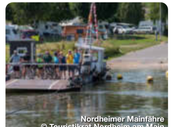
Nordheimer Mainfähre