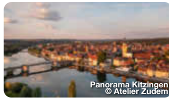
Panorama Kitzingen

Exponate aus fünf Jahrtausenden und vier Erdteilen gibt es im bedeutenden Knauf-Museum zu bestaunen. Die Meisterwerke sind im historischen, ehemaligen Amtshaus in meisterlichen Abformungen ausgestellt. Am Marktplatz, Iphofen