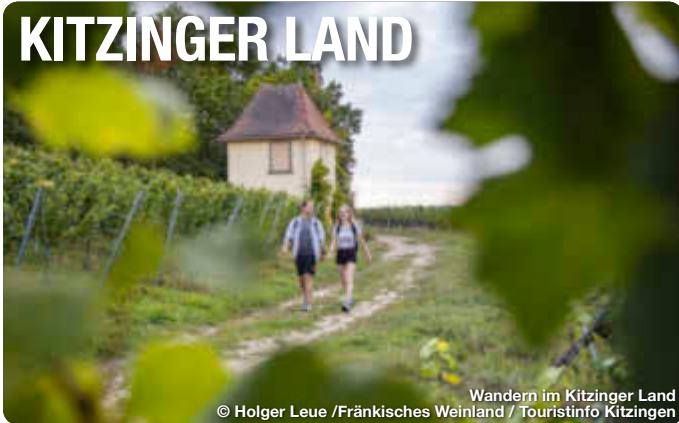
Wandern im Kitzinger Land

Alle Termine und Angaben unter Vorbehalt!