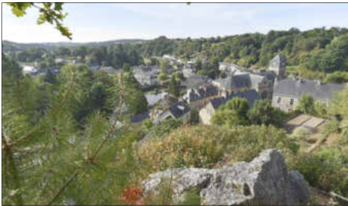
Chailland mit mittelalterlichem Ortskern

Die Fahrt beginnt am Abend des 6. Juni 2025 (Freitag vor Pfingsten) und endet am Abend des 10.06.2025. Wir übernachten in Gastfamilien, die gerne bald wissen möchten, wer alles mitfährt.