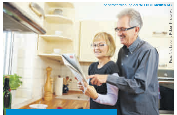
Eine Veröffentlichung der WITTICH Medien KG

Lokal informiert. Druck. Internet. Mobil.