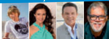
Mickie Krause, Anita Hofmann, Stefan Mross und Wolfgang Trepper