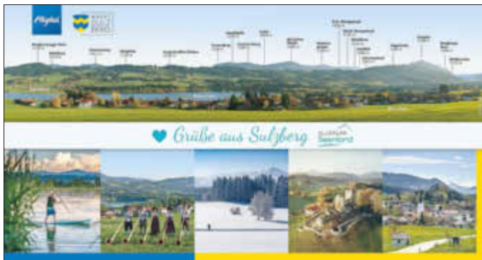
Gerhard Frey 1. Bürgermeister

Aufgrund ihrer Beliebtheit wurde die Maxi-Postkarte mit den Berggipfeln wieder neu aufgelegt, nachdem sie letztes Jahr zur Neige ging. Es wurde das Corporate Design vom Markt Sulzberg verwandt mit gestalterischen Elementen vom Allgäuer Seenland. Grundsätzlich sind Postkarten aus Sicht der Gästeinformation auch in der heutigen Zeit eine schöne und preisgünstige Möglichkeit, unsere Ferienregion authentisch zu bewerben.