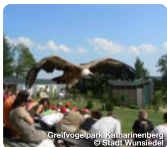
Greifvogelpark Katharinenberg