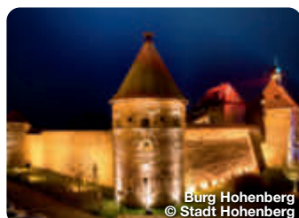
Burg Hohenberg