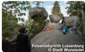
Felsenlabyrinth Luisenburg