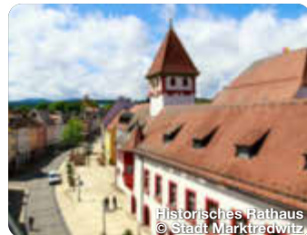
Historisches Rathaus

Kaum ein Ort im zentralen Fichtelgebirge vermag so schauerlich und schön zugleich zu sein, wie das Felsenlabyrinth nahe der Stadt Wunsiedel. Wandern entlang von Schluchten und Höhlen. Luisenburg, Wunsiedel