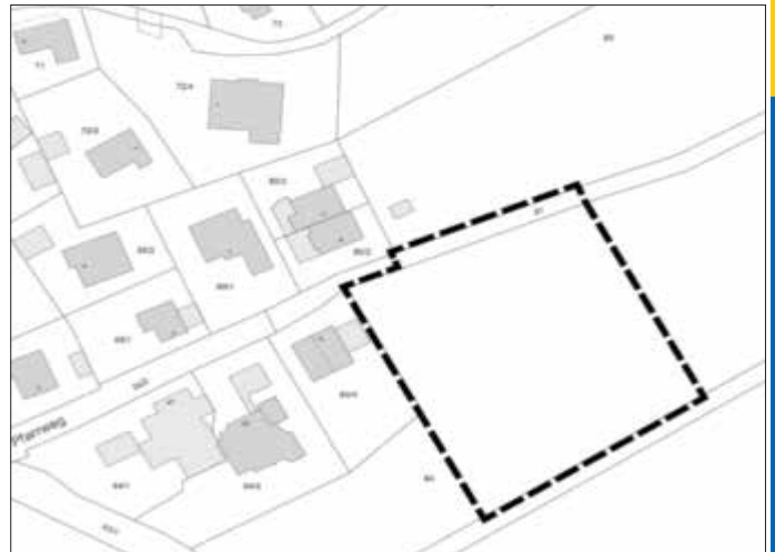
Lageplan des Geltungsbereichs der Bauleitplanung „Kinderintensivpflege SpitzMichl“, unmaßstäblich

Im Einzelnen gilt der Lageplan vom 20.06.2024 Der Lageplan ist im folgenden Kartenausschnitt dargestellt: