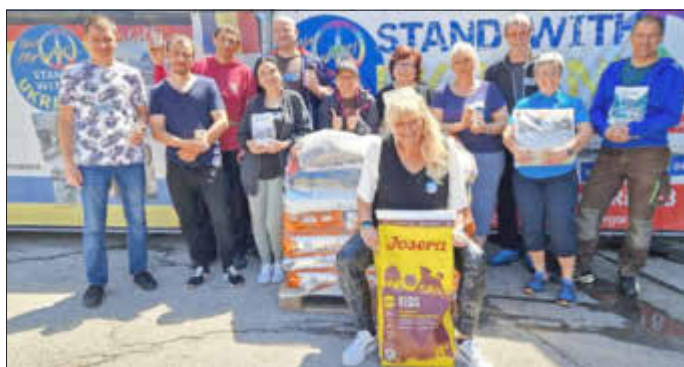
Das ehrenamtliche Helferteam aus Sulzberg freut sich über die Futtermittelspende

Öffnungszeiten: samstags von 9 bis 12 Uhr in Sulzberg, Ried 8; Info-Telefon: 0171/9510445 ab 15 Uhr