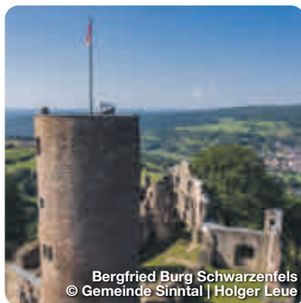
Bergfried Burg Schwarzenfels

www.treffpunktdeutschland.de/main-kinzig-kreis