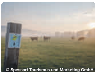
© Spessart Tourismus und Marketing GmbH