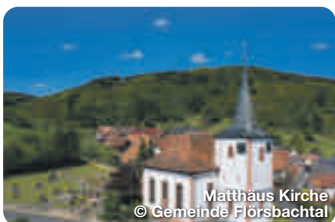
Mattheus Kirche