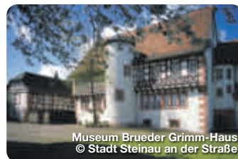
Museum Brueder Grimm-Haus

Die idyllisch, im Naturpark Hessischer Spessart, am Rande von Rhön und Vogelsberg, gelegene Gemeinde Sinnthal bietet reizvolle Wander- und Radwege in einer wunderschönen Mittelgebirgslandschaft. Die seltene Schachbrettblume ist hier ebenso zuhause wie der Biber. Ausgedehnte Mischwälder wechseln sich ab mit grünen Wiesen und Weiden, beschaulichen Flusstälern und malerischen kleinen Orten. Zu den beeindruckendsten Sehenswürdigkeiten zählt die Burg Schwarzenfels, die vor mehr als 700 Jahren hoch über dem Tal der Sinn errichtet wurde, und von deren Bergfried Sie eine herrliche Aussicht über den Spessart in das Sinnthal und in die Rhön haben. TreffpunktDeutschland.de/sinntal