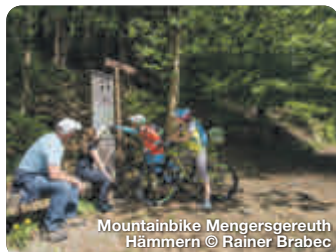
Mountainbike Mengersgereuth Hämmern

Alle Termine und Angaben unter Vorbehalt!