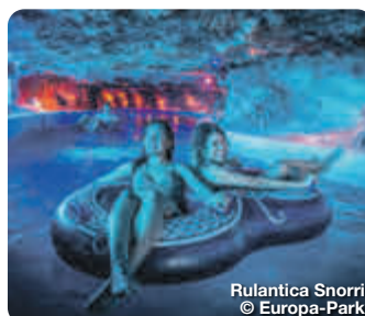
Rulantica Snorri