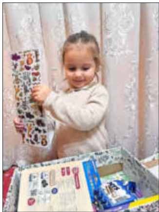
Das Mädchen packt ihr Geschenk aus

Alle 120 Geschenkkartons für Kinder und die Care-Pakete mit Lebensmitteln für Familien sind gut in der Ukraine angekommen. Sie bringen Freude und Hoffnung. Bis in das Kriegsgebiet von Cherson, im Süden der Ukraine, fast 2.400 km vom Allgäu entfernt, wurden die Geschenkkartons und die Care-Pakete von unseren ukrainischen Helfern transportiert. Wir zeigen den Kindern und Familien in den völlig zerstörten Städten und Dörfern, dass wir sie nicht vergessen.