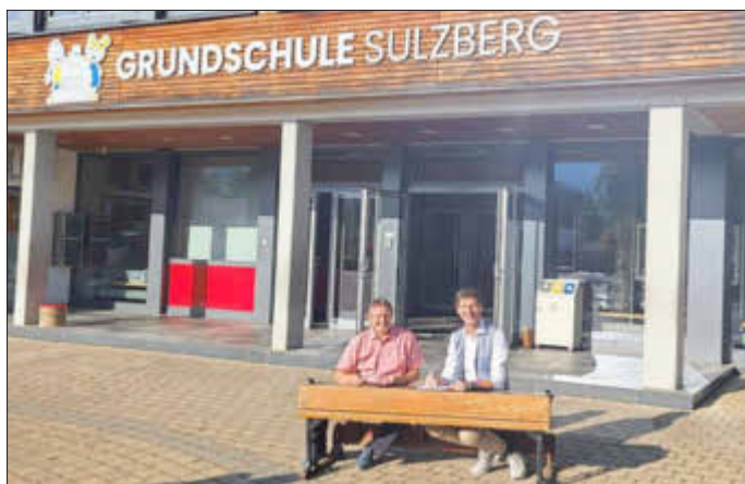
Sulzbergs Erster Bürgermeister Gerhard Frey (rechts im Bild) mit Schulleiter Ralf Tamler vor der Grundschule Sulzberg, über deren Eingang seit kurzem das neue (inhalts-schwere!) Logo prangt.