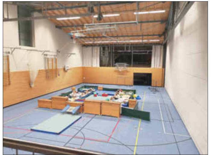
Die TGM-Gruppe (mit ihren Trainerinnen Theresa, Selina, Sigi und Veronika)

Nach dem gemeinsamen Frühstück am Samstag starteten wir erneut in einen Tag voller intensivem Training. Es wurde am Tanz gefeilt, die für uns neue Disziplin Medizinballweitwurf trainiert und natürlich ganz viel geturnt. Nach einem stärkenden Mittagessen wurde am Nachmittag hauptsächlich an der Turnchoreographie gebastelt, aber auch nochmal geworfen und Schwierigkeiten im Turnen geübt. Um 18 Uhr waren dann alle Teilnehmer spürbar erschöpft, aber gleichzeitig sehr zufrieden. Dieses Trainingslager war auf jeden Fall ein großer Erfolg.