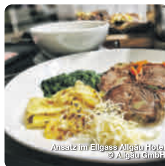
Ansatz im Ellgass Allgäu Hotel