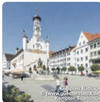
Kempten Rathaus

QR-Code scannen und ganz Deutschland entdecken!