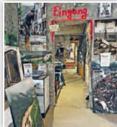
... die außer vielen Bildern auch mehrere Filmsequenzen beinhaltet.

AHRTAL. AFi. Auch fast zwei Jahre nach der verheerenden Flut ist das Ausmaß der Schäden entlang der Ahr weiterhin gegenwärtig. An vielen Stellen sieht es auf den ersten Blick noch immer nicht danach aus – doch es geht voran. Inhaber von Hotels, Restaurants und Geschäften haben, samt ihrer Mitarbeiter*innen, unzählige Stunden Arbeit, verbunden mit viel Hoffnung und Mut, in den Wiederaufbau ihrer geschäftlichen Existenzen gesteckt. Das Ziel: Endlich wieder zahlreiche Tages- und Übernachtungsgäste sowie Kundinnen und Kunden begrüßen zu können. Wanderfreudige Besucher*innen des Ahrtals dürfen sich, neben unvergesslichen Stunden in grandioser Natur entlang