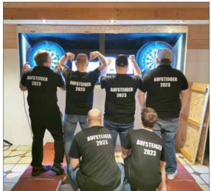
Aufstiegs Mannschaft 2022/2023