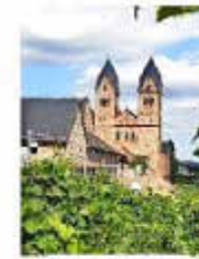
Abtei St. Hildegard