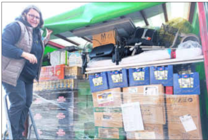
Lebensmittel werden geladen

Öffnungszeiten: samstags von 9 bis 12 Uhr in Sulzberg, Ried 8; Info-Telefon: 0171/9510445 ab 15 Uhr