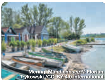
Mering, Mandichosee