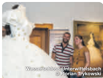
Wasserschloss Unterwittelsbach