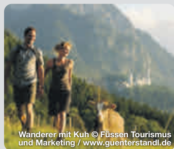
Wanderer mit Kuh