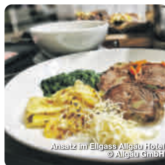
Ansatz im Ellgass Allgäu Hotel