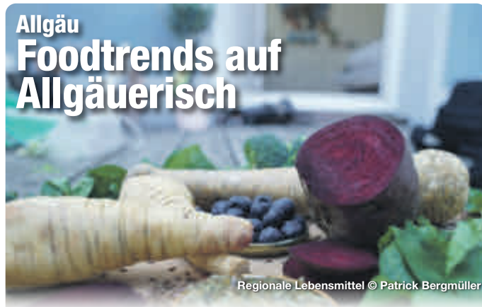
Regionale Lebensmittel

Am Großen Alpsee ist ein breites Angebot an Wassersport nutzbar. Sportlich Aktive können hier segeln, surfen, angeln und baden, einfach an der Seepromenade flanieren oder eine Fahrt mit dem Alpsee-Segler genießen. Immenstadt im Allgäu