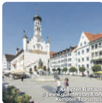
Kempten Rathaus

QR-Code scannen und ganz Deutschland entdecken!